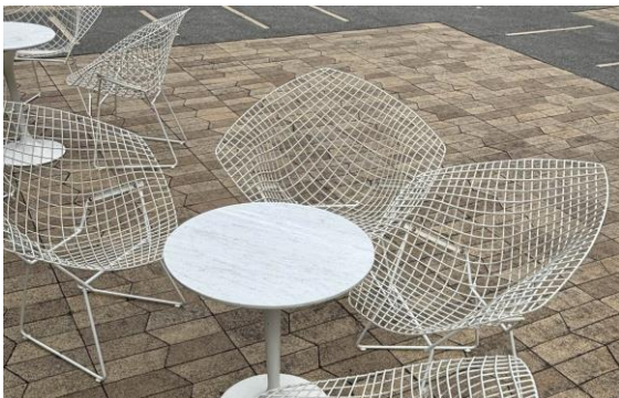
ウォーリーズ 広場

長い椅子と木のテーブルが置いてあるね。 このスペースには明治学院大学に関する歴史の解説パネルが置いてあるよ。