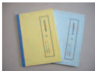
新約聖書約翰傳・馬可傳