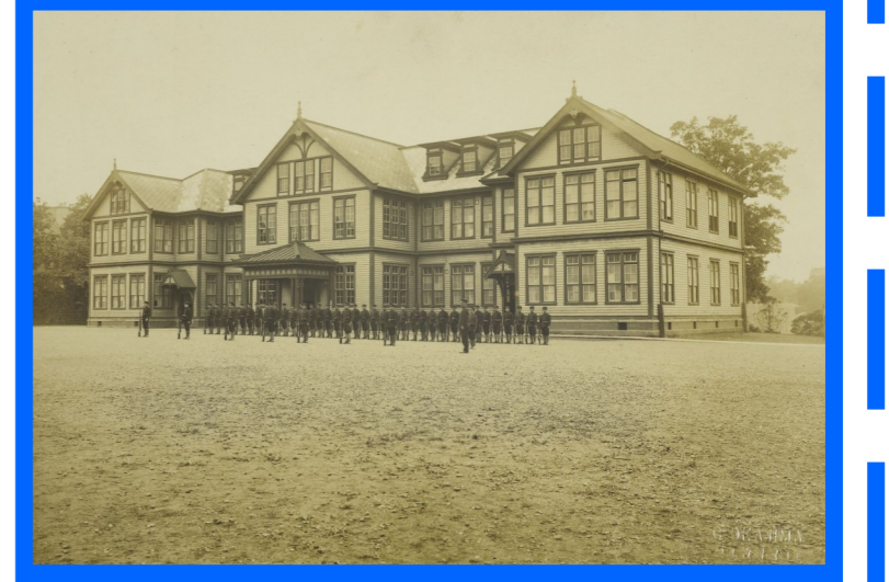
普通学部校舎 1911(明治44)年竣工