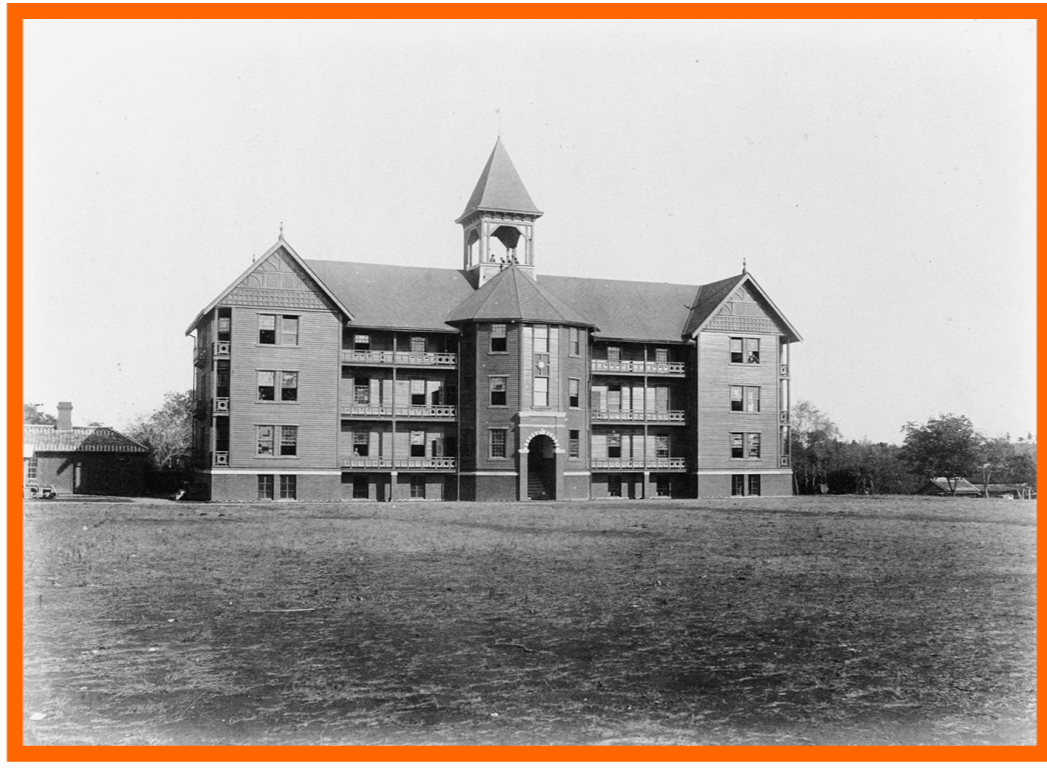
ヘボン館 1887(明治20)年竣工