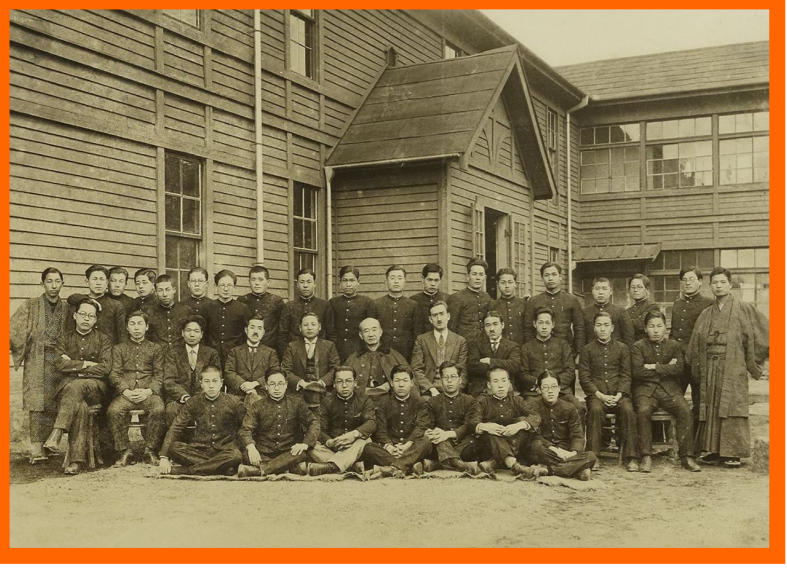
セバレンス館 1907(明治40)年竣工

ミラー記念礼拝堂 1903(明治36)年建築工事開始 1905(明治38)年3月に起きた地震により亀裂が生じる 1907(明治40)年1月修理工事を依頼 1909(明治42)年3月再び地震にあい、使用に耐えきれず取り壊し