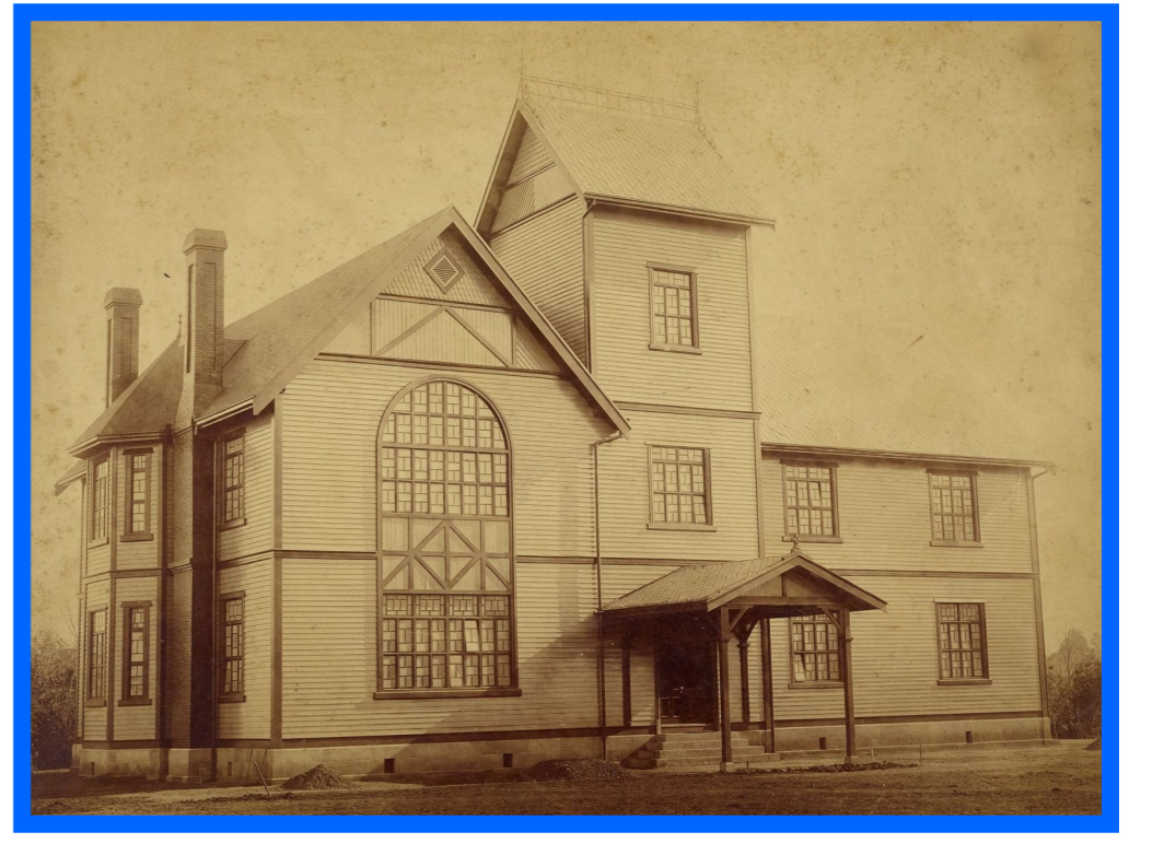
サンダム館 1887(明治20)年竣工