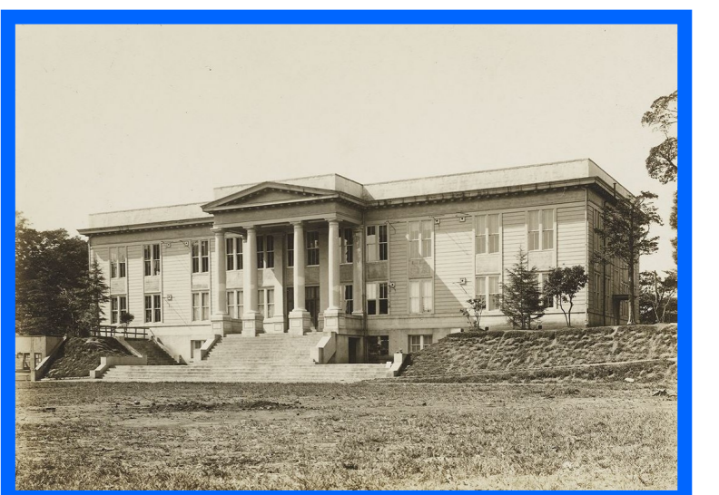
井深ホール 1925(大正14)年竣工