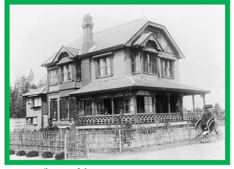
ランディス館 1889(明治22)年頃竣工