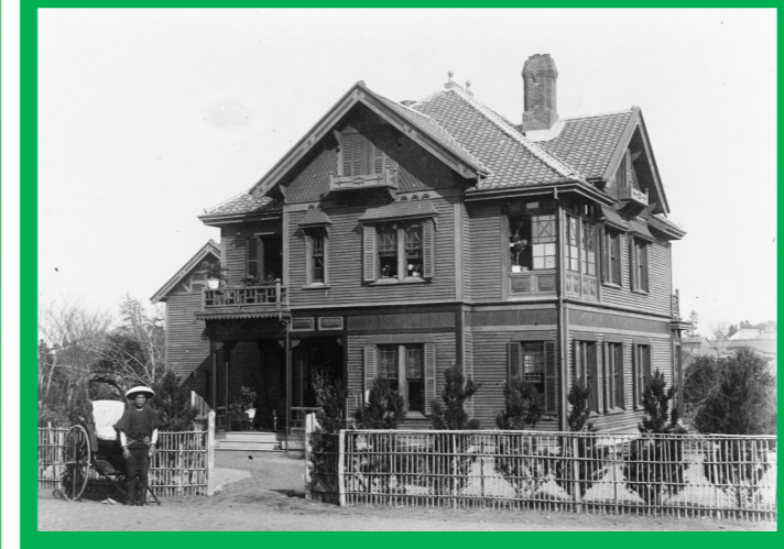
インプリー館 1889(明治22)年頃竣工