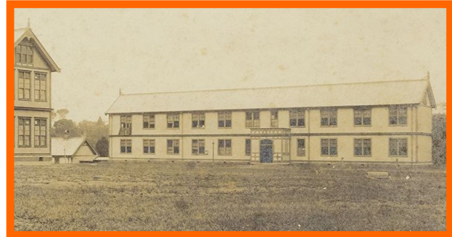
新ヘボン館 1912(明治45/大正元)年竣工

1914(大正3)年11月24日サンダム館の火災による類焼で神学部校舎兼図書館の塔が焼け落ちる