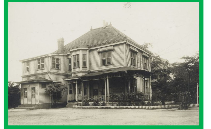
ライシャワー館 1889(明治22)年頃竣工

1894(明治27)年6月20日関東地方を襲った地震により1階を煉瓦造りとしたまま2階部分が木造に改修され、丸屋根はランタンを載せた塔になる