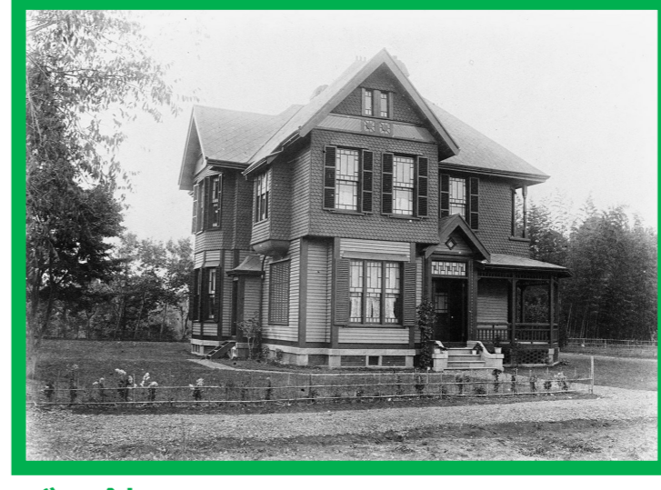
バラ館 1889(明治22)年頃竣工