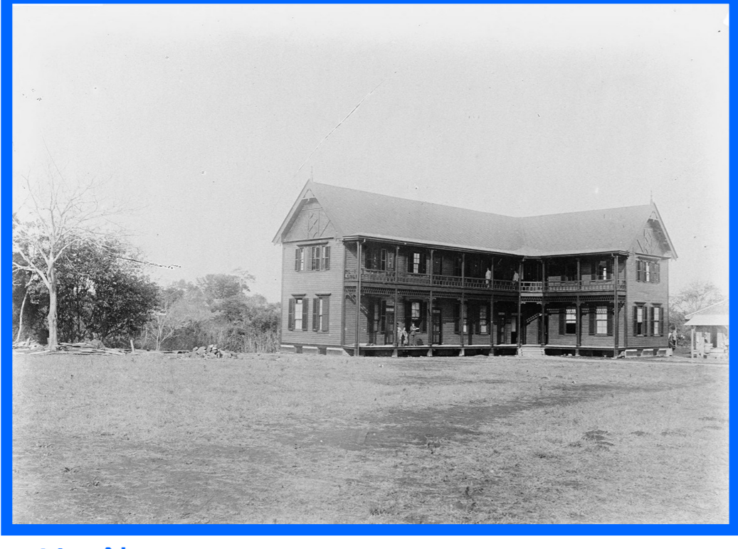
ハリス館 1889(明治22)年移築