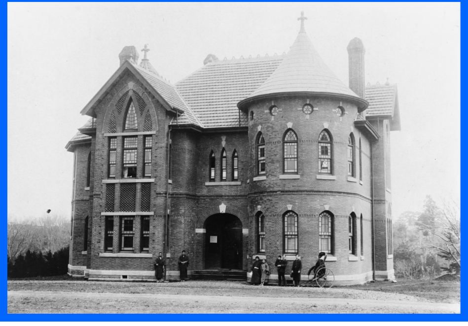
神学部校舎兼図書室(現記念館) 1890(明治23)年竣工