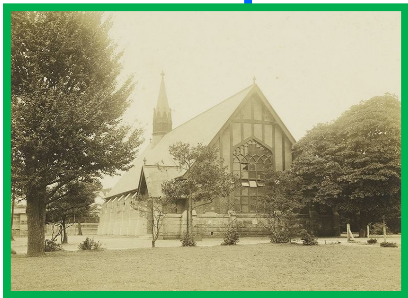
礼拝堂(チャペル) 1916(大正5)年竣工